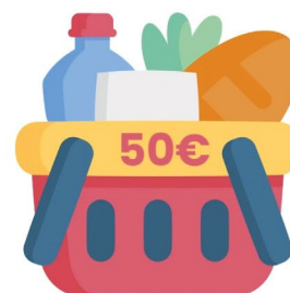
Cesto grande - €51,04