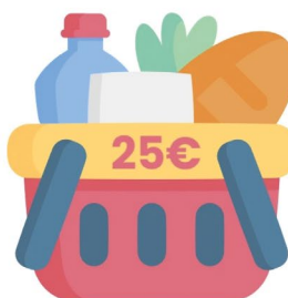
Cesto medio - €25,62