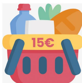
Cesto piccolo - €15,74